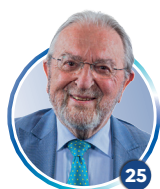
Herman De Croo