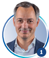
Alexander De Croo

Kleur je het bolletje bovenaan de lijst, dan geef je een lijststem en kies je voor de partij die jij aan zet wilt.